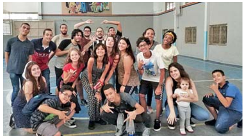
Juventudes realizam tarde de gincana para dar início às atividades do novo ano.