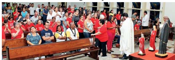
Jornada catequética iniciada com espiritualidade e formação paroquial e concluída na Cúria Regional