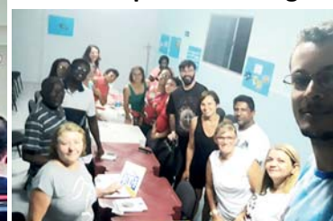
Adultos e jovens participam da celebração da entrega da Palavra, com seus catequistas e introdutores