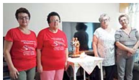
Abertura do ano pastoral e envio das células de evangelização em missão