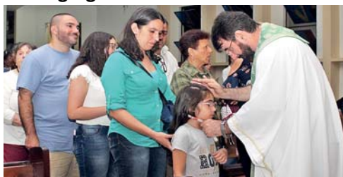
Comunidade recebe a bênção da garganta no dia de S. Brás