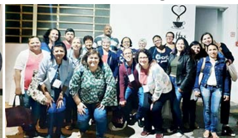
Recepção dos pais e crianças que estão iniciando este ano – IVC