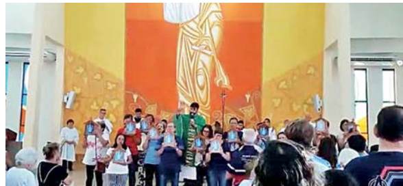
Bênção e envio das Capelinhas de Nossa Senhora – a mãe visitando nossas casas