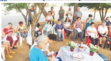
No dia de N. Sra. de Fátima o já tradicional terço na praça aconteceu novamente com bonita participação da comunidade