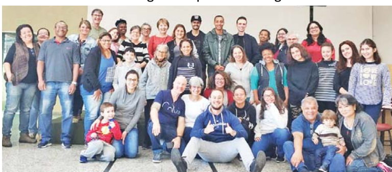
Uma noite especial para comemorar o dia de São Leonardo com a família de Murialdo: AMA (Mães Apostólicas), SAMPALAM (Leigos Amigos de Murialdo), Rede JuventudeS de Murialdo e nosso religiosos.