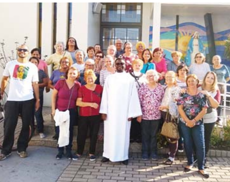
Encontro de Mães e Pais apostólicos Curso de Eneagrama