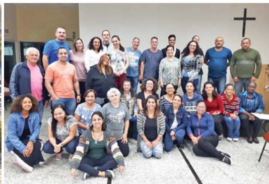
Começando uma tradição... almoço de aniversário da Dedicção do nosso templo ao senhor!