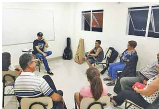
Enfim, o sonho da Escola de Música litúrgica está se realizando! Turmas de violão, teclado, canto coral e iniciação musical infantil estão a todo vapor. Em breve, nossas missas terão ainda mais vida!