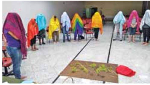
Técnica do bibliodrama sendo utilizada para aprofundamento bíblico na reunião de lideranças celulares