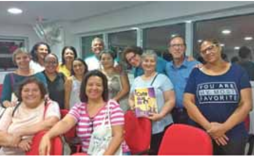
Membros da IVC participam de formação na Cúria de 11 à 13 março