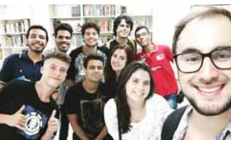
Sinal da alegria do evangelho entre nós, tem início o grupo de jovens da Pastoral Juvenil! Juventude, venha participar!!!