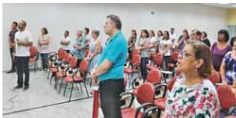
Semana Social reflete o tema da Campanha da Fraternidade. A prática de Jesus como luz para nosso agir diante das políticas públicas hoje: Verdade, imparcialidade, cuidado com os mais empobrecidos, obediência à vontade de Deus.